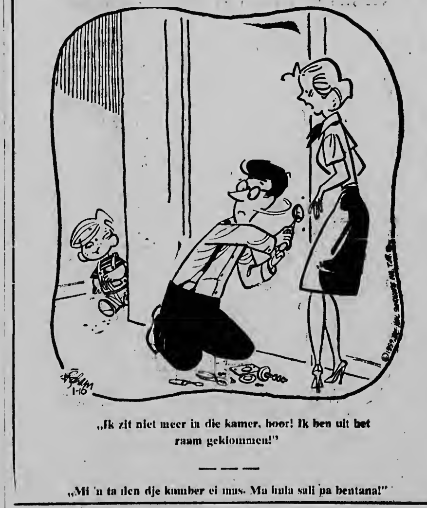
„Ik zit niet meer in die kamer, hoor! Ik ben uit het raam geklommen!” „Mi 'n ta den dje kumber ei mus. Ma hula sali pa bentana!”

doe siman pa laga sa con ta para, locual na a tuma lugar, pa notibo cu P. no tabatin chens pa haya e dos mil florin ningun caminda. C. ta worde acusa di „esfuerzo pa estafa”. Ora cu durante un dje ultimo lunanan di anja pasa, huez mester a duna su decision den e caso aki, e la sentencia acusado pa tres luna di prison. Pa cual C. a firma hoger beroep. Mescos cu C. a nenga durante e corte di prome instancia e tempo di, asina e tabata nenga trobe den e corte diamars mainta. Locual e ta splica den e caso tabata esaki, cu e la lesa den corant cu e portugues a hanja un accidente. Como e tabata interesa den e auto kibra, un Chevrolet, e la laga yama D.P. serca dje. Ora cu esaki a yega, di su mes e la pidi C. pa yudele den e caso cu e ta hanjele aden. Ora cu C. ta puntra P. cuanto e ta dispuestu pa paga pa algun conseho, esaki a menciona un suma asina abao, cu sin mas e la mustrele na unda e porta ta keda.